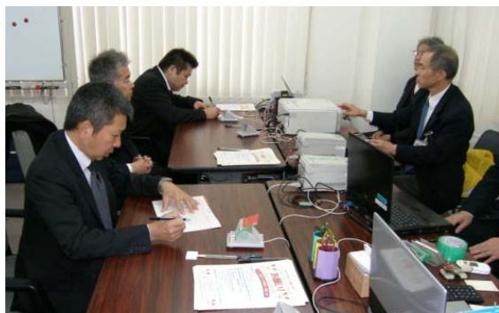
受付をされています。