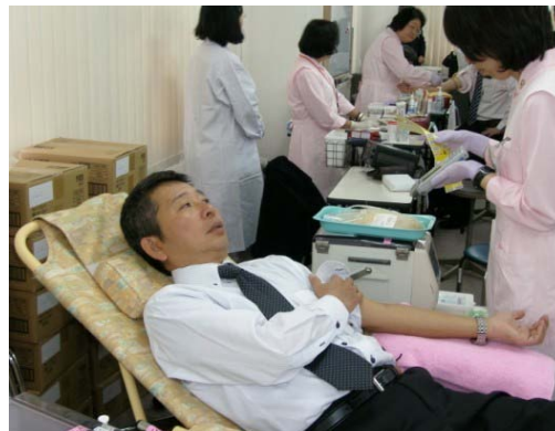
採血前に看護師さんから説明を受けています。