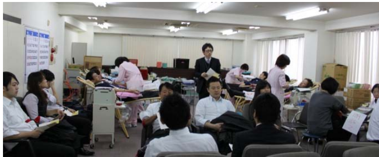
たくさんの参加者で賑わう待合室