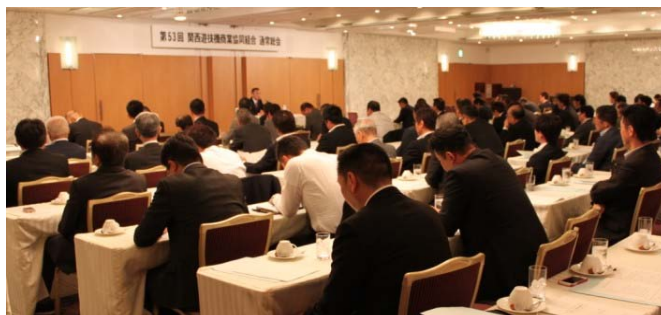
講話を聴く組合員の皆さん

「保証書」を作成する遊技機取扱主任者の役割が一層重要となります。 貴組合はかねてより適正な関係書類作成に務められていますが、ひとたび不正が発覚した場合、今まで積み重ねてきた信用・信頼を損ないます。組合員全ての取扱主任者に「保証書」の重要性を再認識して頂きたいと思っております。