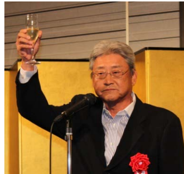
京都府遊技業協同組合 白川理事長様 による乾杯のご発声