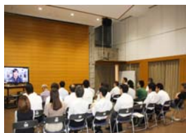
(映像による研修風景)