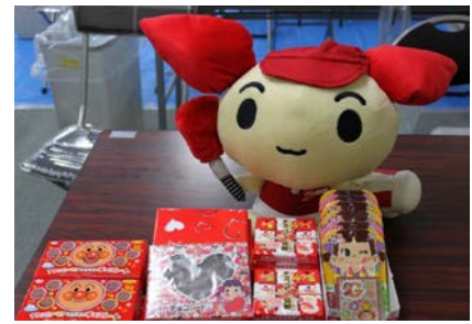
感謝の気持ちをチョコレートで♥