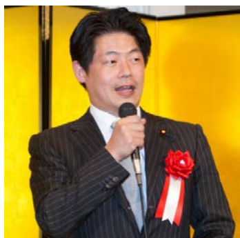
ご来賓の挨拶 衆議院議員 松浪健太先生