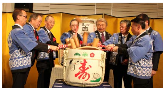
更なる発展と健康を祈願して「鏡開き」