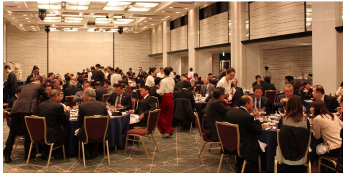
*新年祝賀会には116社の組合員の皆様にご出席くださいました。