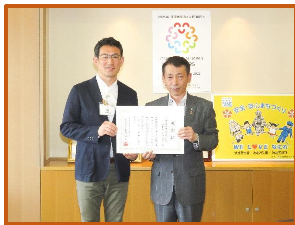
《榊区長と草加理事長》