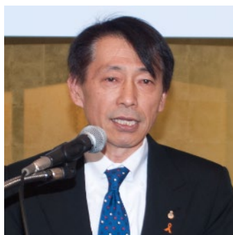
草加理事長の挨拶

日 時 : 令和元年5月22日(水) 午後3時 開始 場 所 : ホテル日航大阪 32階「スカイテラスの間」にて 出席者数 : 127名(委任状出席者含む)