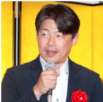
大阪府議会議員 松浪健太先生のご挨拶