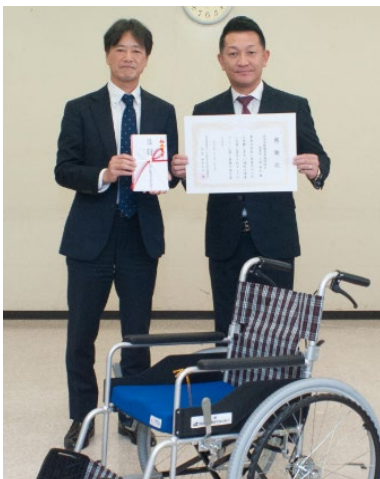
目録の贈呈と感謝状