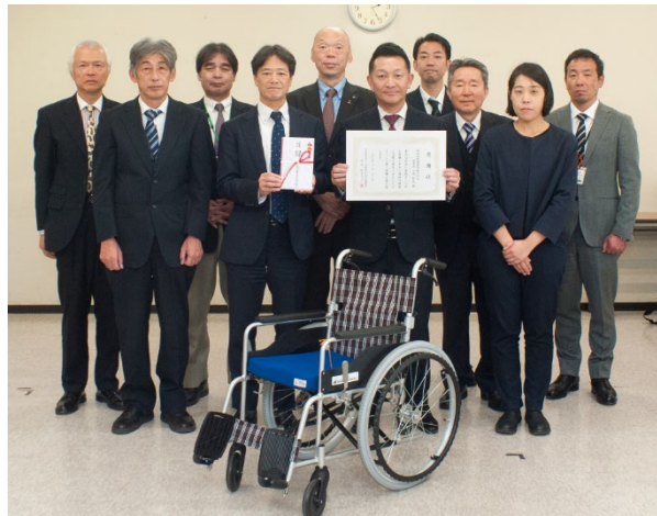
各地域社会福祉協議会の皆様