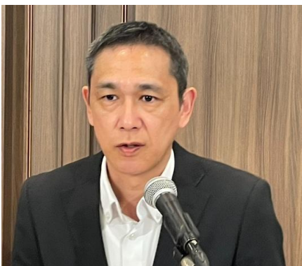
大阪府警察本部 生活安全部保安課