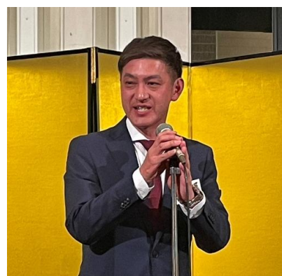
北副理事長による中締めのご挨拶